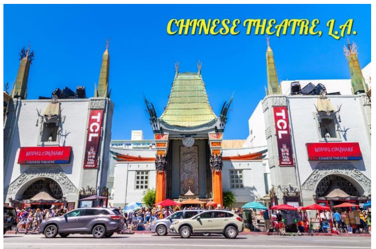
CHINESE THEATRE, L.A.

นำท่านชม “มหานครลอสแอนเจลิส” (LOS ANGELES) (L.A.) ซึ่งเป็นเมืองใหญ่ที่มีประชากรมากที่สุดอันดับสองในสหรัฐอเมริกา และเป็นหนึ่งในศูนย์กลางทางด้านเศรษฐกิจ วัฒนธรรม และการบันเทิงลอสแอนเจลิส ตั้งอยู่ในมลรัฐแคลิฟอร์เนีย ชื่อเมืองลอสแอนเจลิสมาจากคำว่า โลสอังเกเลส (Los Angeles) นำท่านผ่านชมย่านธุรกิจ สำคัญ ย่านไชน่าทาวน์ ศาลาว่าการเมืองมิวสิกเซ็นเตอร์ ถนนฮอลลีวูด เบเวอร์ลี่ฮิลล์ ถนนโรดิโอ ไดรฟ์ (RODEO DRIVE) ในย่าน BEVERLY HILL ซึ่งเป็น